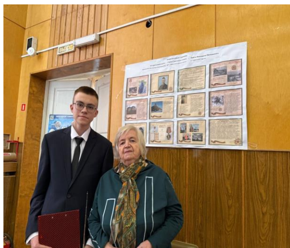
Региональный этап областного конкурса исследовательских работ «Древо жизни»