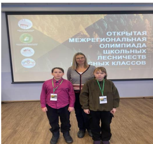
Открытая Межрегиональная Олимпиада школьных лесничеств и лесных классов, приуроченной к Международному дню леса