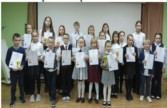
Межрегиональный этап конференции по краеведению «Первые шаги в науку» и областной конкурс исследовательских работ по краеведению «Первое открытие»

В 2025 году 24 работника сферы образования награждены наградами Министерством просвещения Российской Федерации, Губернатора области, Министерства образования Вологодской области.