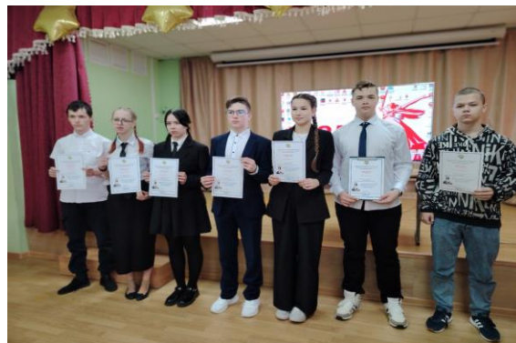
Межрегиональный этап олимпиады по научному краеведению «Мир через культуру»